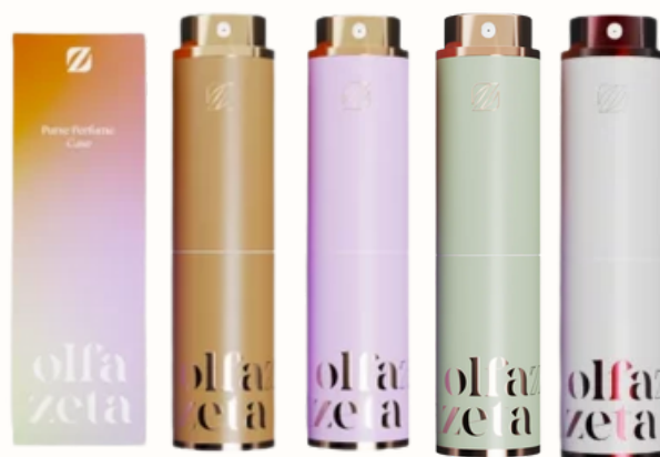
TCOV013 TCOV011 TCOV012 TCOV010